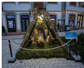
Parada de Cunhos