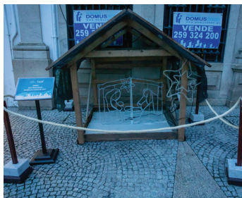
União das Freguesias de Borbela e Lamas de Ôlo