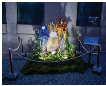
União das Freguesias de Constantim e Vale de Nogueiras