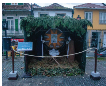
União das Freguesias de S. Tomé do Castelo e Justes