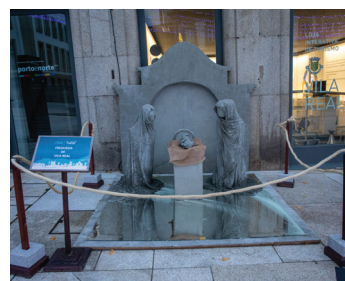
Freguesia de Vila Real