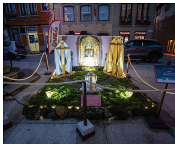
União das Freguesias de Mouços e Lames