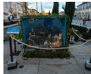
União das Freguesias de Adoufe e Vilarinho de Samardã