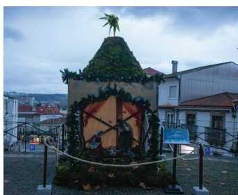
União das Freguesias de Pena, Quintã e Vila Cova