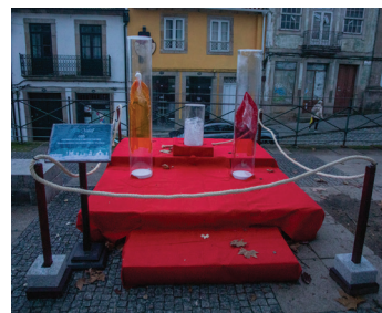
Centro Cultural e Desportivo – CCD