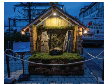
União das Freguesias de Nogueira e Ermida