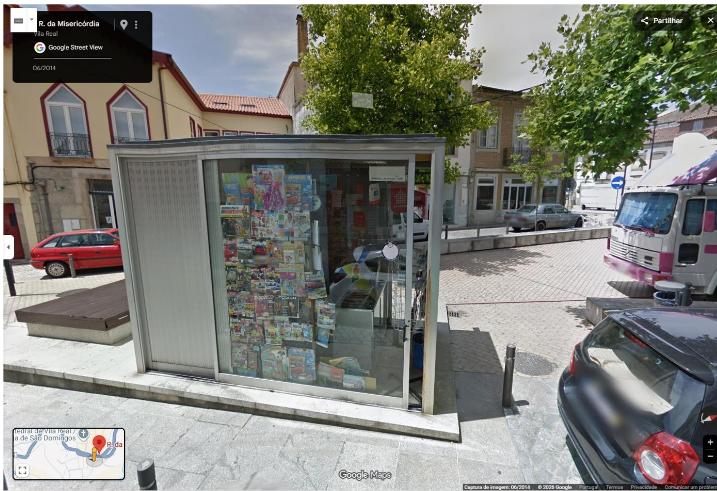
Imagem: Quiosque Municipal – Rua da Misericórdia